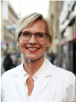
Birte Riebelmann e.K.