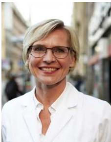
Birte Rießelmann e.K.