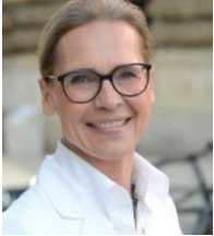
Birte Rießelmann e.K.