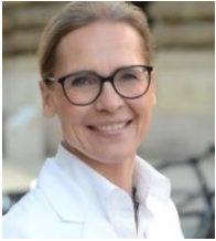
Birte Rießelmann e.K.